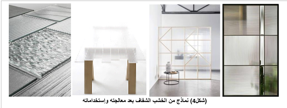
(شكل4) نماذج من الخشب الشفاف بعد معالجته وإستخداماته

لقد حول الباحثون في جامعة ميريلاند كتلة من أحد الخامات الخشبية إلى كتلة شفافة، وهم يرون أنها ستكون مفيدة في مواد البناء المستقبلية وفي الأنظمة الإلكترونية القائمة على الضوء. فقد نجح فريق البحث بمشاركة علماء مركز بحوث الطاقة في إزالة اللجنين من الخشب، في حين استبقوا على هياكل خلايا السليلوز عديمة اللون ثم يتم ملؤها بمادة لاصقة لينتجوا نسخة شبه شفافة من الخشب. وتعتبر عملية إزالة اللجنين نوعاً من تغيير في لون الخشب ليصبح أبيض، ويعمل الفريق على جعله أكثر وضوحاً بواسطة القليل الهندسة النانوية، حيث توصلوا إلى نتيجة هامة وهي الحصول على قشرة خشبية مسامها السطحية مليئة ببوليمر شفاف. وفي المعهد الملكي للتقنية بجامعة ستوكهولم بالسويد توصل الباحثون من خلال عملية كيميائية لإزالة اللجنين الطبيعي الذي يعد مكوناً من مكونات جدران خلايا الخشب. وهذه الخلايا تعمل كقنوات عمودية متوازية في الخشب تشكل هيكلاً طبيعياً يمكن استخدامها لتمرير الضوء من خلالها بعد معالجة الخشب (شكل4).