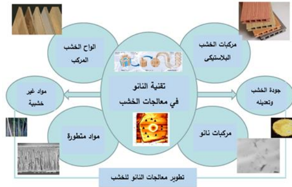
(شكل 1) تطوير معالجات الخشب بتقنية النانو

إن تعديل الخشب من خلال المعالجات التقليدية السابقة يمكن أن يحسن عادة المقاومة ضد الهجمات الفطرية والخواص الميكانيكية للخشب، بينما معظمها لا يوفر حماية كافية طويلة المدى ضد الحشرات الضارة للخشب وتغيير أبعاده. لذلك كانت تستخدم طرق المعالجة والحماية المختلفة للحفاظ على الخشب مدة أطول، وتطورت تكنولوجيا معالجات الأخشاب حتى ظهرت تقنية جديدة ناشئة والتي شهدت إمكانات كبيرة لتطوير ومعالجة الخشب، وهي تكنولوجيا النانو التي تستخدم في الحفاظ على الأخشاب، وهي تقنية تمتلك مميزات وتطبيقات عديدة مطورة لحماية الخشب، وتقدم معالجات النانو منظوراً