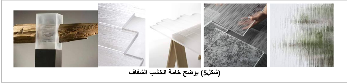
(شكل5) يوضح خامة الخشب الشفاف

وبفضل هذه الخصائص البصرية الفريدة يمكن استخدام مركب الخشب الشفاف ذي ألياف السيليلوز النانوية في صناعات أخرى مثل الإلكترونيات الضوئية المستخدمة في الخلايا الشمسية، ومن المثير للانتباه أن هذه المواد تأتي من مصادر متجددة، كما أنها تحمل أيضاً خصائص ميكانيكية ممتازة، بما في ذلك القوة والصلابة، وإنخفاض الكثافة والموصلية الحرارية المنخفضة. إن هذا الاكتشاف الأخير من شأنه صنع تأثير كبير في تكنولوجيا العمارة والتصميم الداخلي، فيمكن إستخدامه مستقبلاً بديلاً لزجاج النوافذ وتكسية الواجهات في المباني. حيث توفر مواد تسمح للضوء بالمرور مع الحفاظ على الخصوصية. والطاقة الشمسية، ولا تنضب، ونظيفة. وتتمثل الخطوة التالية للباحثين في توسيع عملية التصنيع وزيادة الشفافية في المنتج النهائي. والخشب الشفاف له خصائص ميكانيكية مهمة بيئياً، فإذا كانت درجة الحرارة الخارجية مرتفعة، يمكن لهذا الخشب الشفاف الإحتفاظ بالحرارة قبل أن تصل إلى داخل المبنى، وفي الليل عندما تنخفض درجة الحرارة الخارجية، يطلق الخشب الشفاف الحرارة، ما يساعد على تنظيم درجة الحرارة الداخلية للمبنى بصورة تفوق وحدات الزجاج العازل. وتنبأ الباحثون بأن الخشب الشفاف يمكن أن يكون متاحاً للتطبيقات المتخصصة في التصميم الداخلي خلال أقل من خمس سنوات. [19]