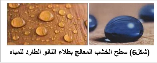
(شكل6) سطح الخشب المعالج بطلاء النانو الطارد للمياه

نانومتر، وهذه المواد تنصدر التطبيقات التكنولوجية الحديثة، وتعتبر ذات اهمية إقتصادية كبيرة حيث تدخل في أكاسيد الفلزات وأكسيد السيليكون واكاسيد التيتانيوم وأكسيد الألومنيوم، وأكاسيد الحديد، وأكثر إستخدامات هذه المواد في البويات والطلاء ومواد البناء الخارجية والداخلية. يستخدم طلاء النانو فائق الطرد للماء للحفاظ على الخشب حيث يقوم بطرد الماء في شكل قطرات دون ترك أى أثر على الخشب (شكل6) أثناء غزلق هذه القطرات، وتسمح هذه التقنية بعدم تسرب الرطوبة للخشب وتعرضه للعفن، وبالتالي فقدان صلابته. [20]